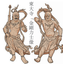
東大寺「金剛力士像」

◆本体価格 1,500 円 ◆四六判オールカラー 168P ◆ISBN:978-4-908443-92-3