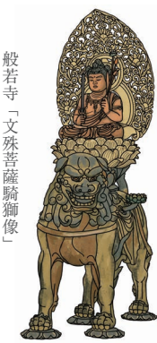
般若寺「文殊菩薩騎獅像」

奈良では、時代を超えた仏像に出会うことができるのです。 本書ではエリア別に115件の仏像を紹介しています。本書も持って奈良へのお参りの旅、いかがでしょうか。